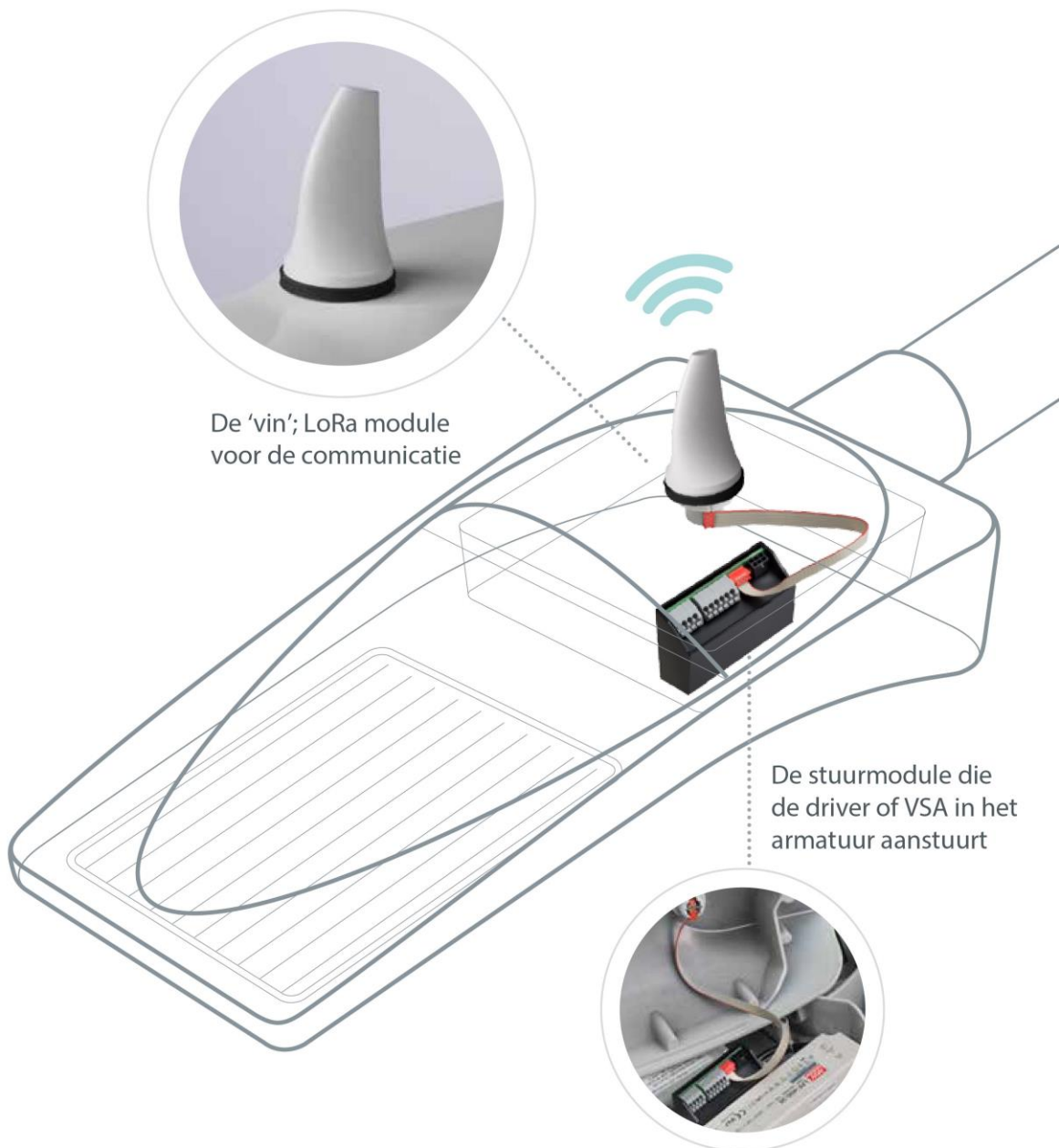
Afbeelding 1: Onderdelen van de LoRa TeleController